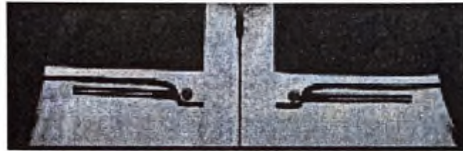
<그림: 甲의 등록디자인의 가슴절개부>

甲과 乙은 모두 작업복을 제조·판매하였는데, 甲은 ‘작업복 상의’ 디자인을 등록하였다. 乙이 판매한 작업복의 상의는 甲의 등록디자인과 앞·뒷면의 몸체상부와 팔 부분은 짙은 색, 몸체하부는 밝은 색으로 배치한 점 등에서 대부분 유사하였는데, 위와 같은 특징들은 甲의 등록디자인의 출원 전에 이미 공지되었다. 그러나 甲의 등록디자인에는 ‘지퍼 형상의 가슴부위 절개선’이 있었는데(그림 참조), 이는 일반적인 작업복 앞면에서 흔히 볼 수 있는 형상이 아니었다. 乙의 작업복 상의에는 甲의 등록디자인과 유사한 모양의 ‘가슴부위 절개선’이 없었다. 다음 물음에 답하십시오. (다음 각 설문은 독립적임)